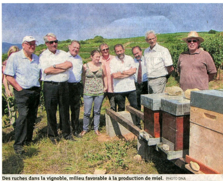
Des ruches dans la vigne, milieu favorable à la production de miel.